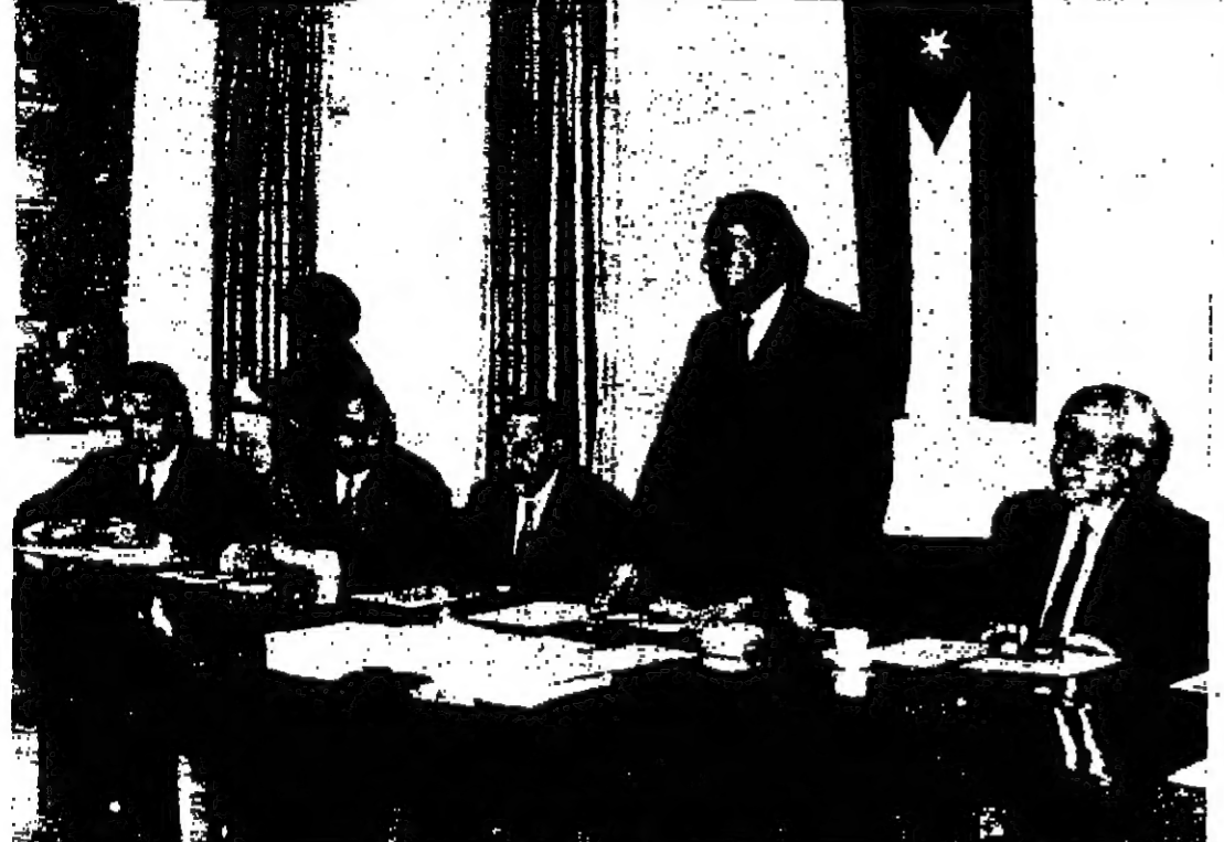
الدكتور احمد ابو قوره الرئيس العام للامم المتحدة يفتتح الاجتماع السنوي للجنة العامة للامم المتحدة والى يمينه السيد بهجت القاتوني رئيس الوزراء والسيد خلف القايز وزير المواصلات اللذان حضرا الاجتماع بوصفهما مسؤولين في اللجنة العامة والدكتور يوسف لغهي السكرتير العام للامم المتحدة . والى يسار الدكتور ابو قوره الدكتور جيسلر اليوناني الرئيس العام السابق للامم المتحدة

الخميس في ٦ محرم سنة ١٣٨٨ هـ الموافق ٤ نيسان سنة ١٩٦٨ م رقم العدد ٢٥٢ AD-DUSTOUR - ARABIC DAILY NEWSPAPER AMMAN THURSDAY 4/4/1968 No : 353